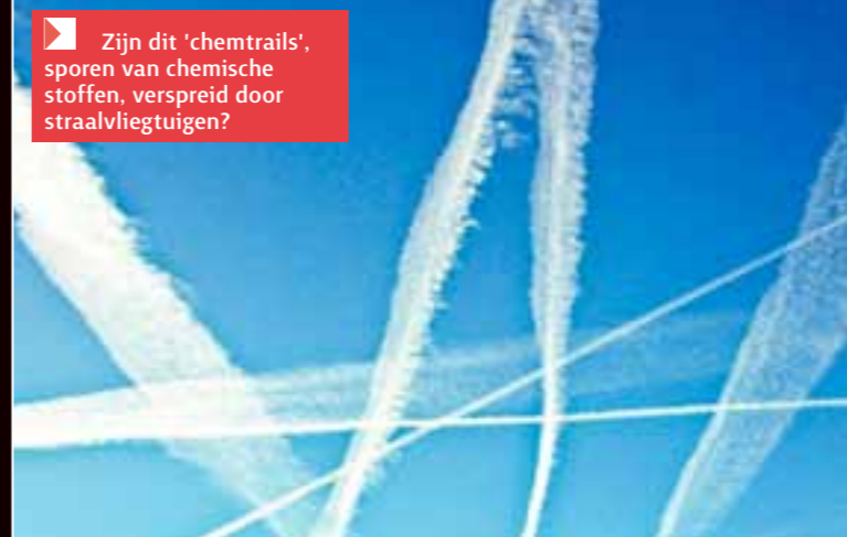
► Zijn dit 'chemtrails', sporen van chemische stoffen, verspreid door straalvliegtuigen?

is dat het over apparaatuur zou beschikken om aardbevingen en tornado's op te wekken, poolkappen te laten smelten, vliegtuigen en raketten overal op aarde