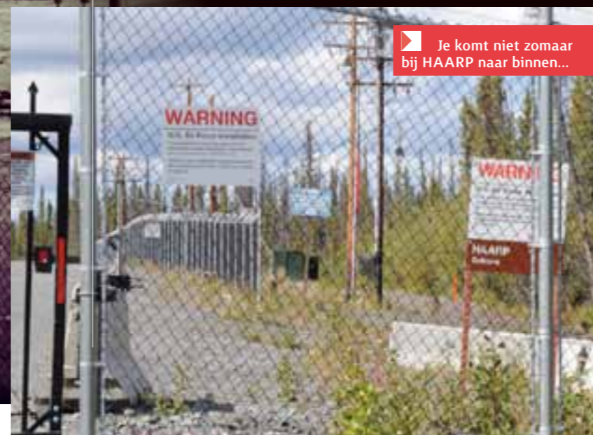
► Je komt niet zomaar bij HAARP naar binnen...

► In zijn latere jaren verloor Tesla door bizarre beweringen veel prestige en werd hij een toonbeeld van 'de gekke geleerde'. Niettemin zijn het juist zijn meest speculatieve en onbegrijpelijke ideeën – waaronder die van de vrije energie – die Tesla de cultstatus gaven als wetenschapper die de wereld nog niet rijp achtte voor zijn vondsten.