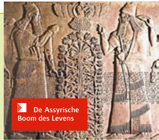
De Assyrische Boom des Levens

na de vloed leefden, dan is het verbazingwekkend dat zij nog zoveel flarden van de geschiedenis in de Hof van Eden kennen. Dat er een heleboel is vervaagd en verwaterd, is dan ook niet vreemd; de geschiedenis werd vanaf Noachs tijd bij veel volken vaak mondeling (en via Sem ook schriftelijk) doorgegeven van generatie op generatie. Dan komen er elementen bij die niet oorspronkelijk zijn, en