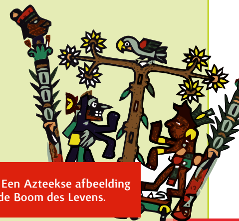
► Een Azteekse afbeelding van de Boom des Levens.

Niet meer dan een verhaal, denken velen. Het is, zeggen ze, net zo iets als de mythes van de Grieken en Romeinen: verzinsels die men ooit heeft opgetekend en uiteindelijk zijn ze in de Bijbel terechtgekomen. Maar stél nou eens dat de gebeurtenis in