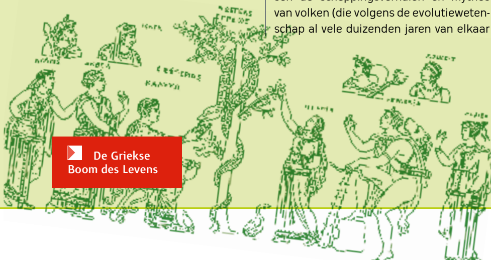
▶ De Griekse Boom des Levens