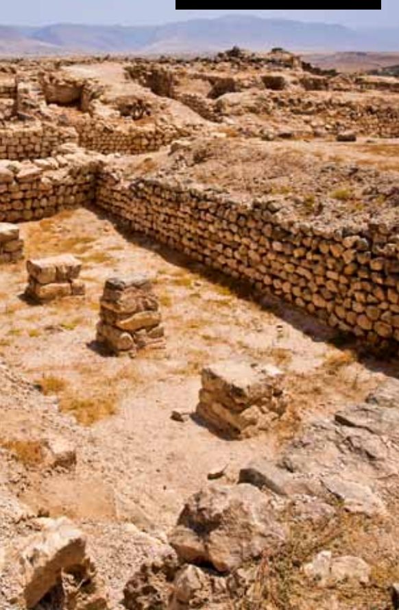
De ruïne van de haven van Sumharam (Oman). Hier zou de koningin van Scheba regelmatig een kijkje nemen om te zien wat er verhandeld werd.