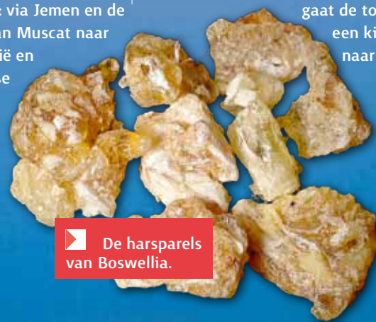
De harsparels van Boswellia.

Vandaag de dag stromen de souks in steden als Salalah en Muscat over van de wierookwinkels. Voor een euro of twintig gaat de toerist met een kilo reukwerk naar huis.