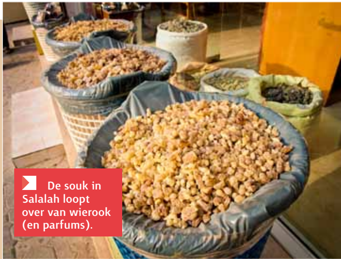
De souk in Salalah loopt over van wierook (en parfums).

Sulayman, zo vertelt de gids, was bovendien gezegend met de wonderlijke eigenschap dat hij met dieren kon spreken. Hij had een bijzondere band met hen. Als de profeet ging eten, schoven al z'n dieren aan. Tijdens een aangerichte maaltijd, zo luidt een andere legende, constateerde Sulayman dat er een vogeltje aan de dis ontbrak. Hij maakte zijn verwondering publiek en kreeg spoedig te horen dat het beestje het paleis van de koningin van Scheba had gevonden. Dat was goed nieuws. Al snel kwam de profeet meer over haar te weten. Ze zou een vermogende en slimme vrouw zijn en, net als