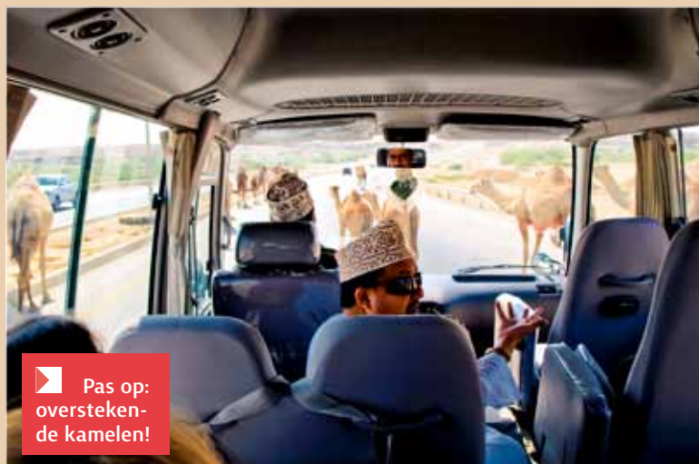
Pas op: oversteken de kamelen!