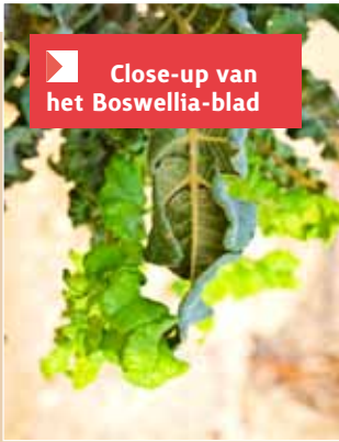
Close-up van het Boswellia-blad

pilaren voor de tempel en muziekinstrumenten zoals harpen en luiten. De sandelboom komt veel voor in India. Het is dan ook niet ondenkbaar dat