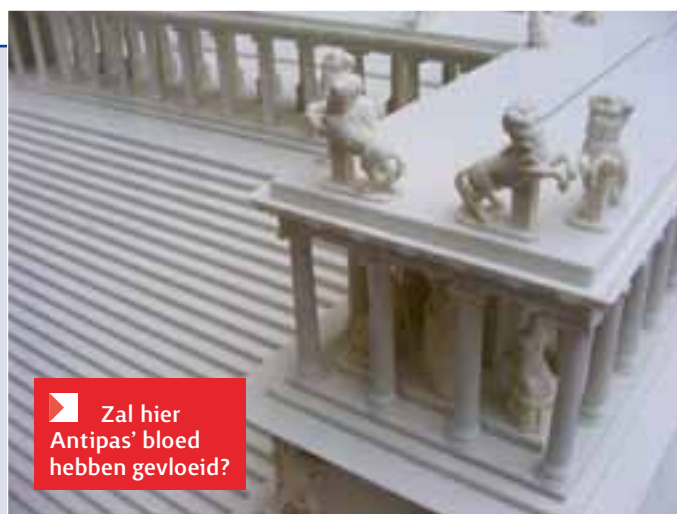
Zal hier Antipas' bloed hebben gevloeid?

was een belangrijk onderdeel van de Romeinse religie. De cultus verspreidde zich over het hele rijk en werd opgelegd aan