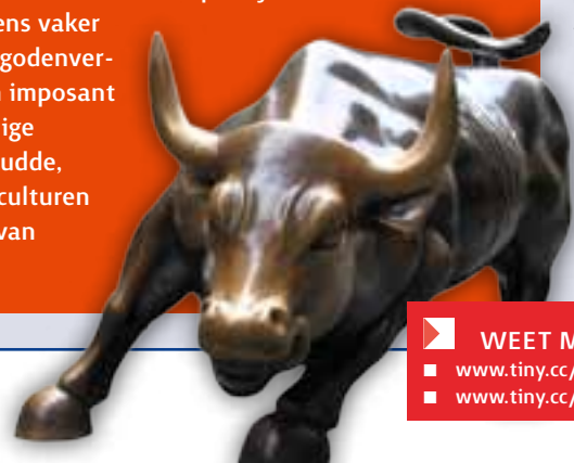
WEET MEER: www.tiny.cc/dollestier1 www.tiny.cc/dollestier2

De stier en Zeus zijn dus onlosmakelijk met elkaar verbonden. Het verhaal dat Antipas stierf in een messing stier past wat dat betreft goed in het plaatje.