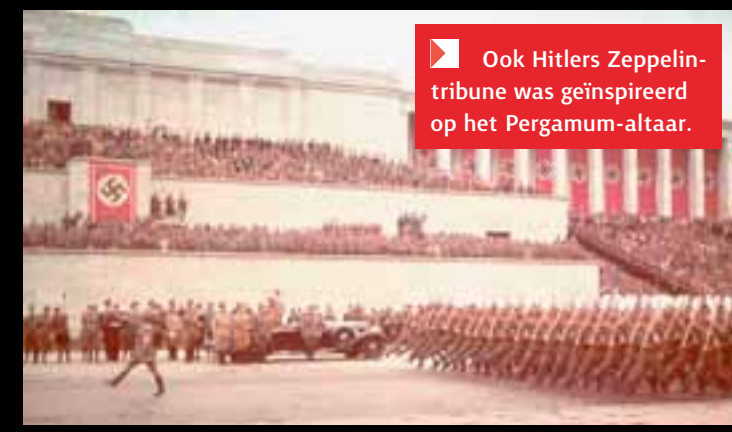
Ook Hitlers Zeppelin-tribune was geïnspireerd op het Pergamon-altaar.