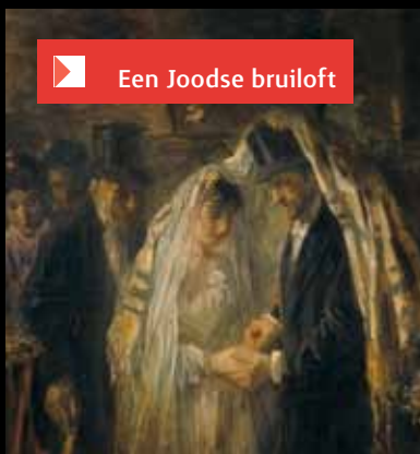
Een Joodse bruiloft

Vanaf dat moment, stelt Darlington, hebben de teruggekeerde Joden geprobeerd om hun etniciteit te bewaren door alleen uit te huwelijken met mensen uit de eigen groep.