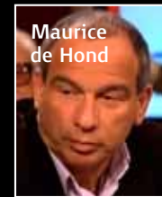
Maurice de Hond