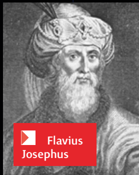
▶ Flavius Josephus

In Psalm 147 vers 4 staat dat God elke ster telt en bij name noemt. Oeroude culturen verdeelden de sterrenhemel al in sterrenbeelden. In Job 9 vers 9 staan er een paar. De zon