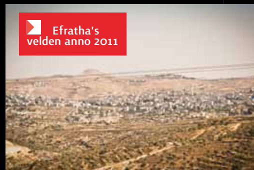
Efratha's velden anno 2011

Ook geeft Lukas aan dat er herders met hun kudde 's nachts in het veld waren. Dat is vreemd! Herders brachten hun